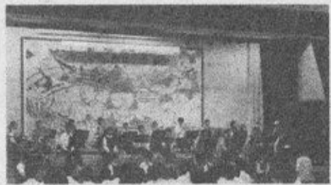
<吹奏楽部・コンサート>